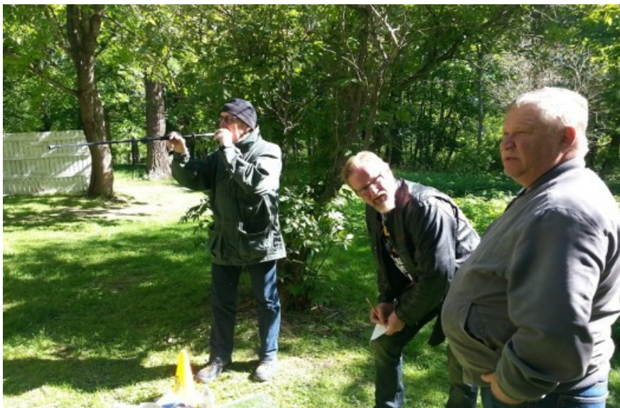
Puhallusputken käytön opiskelua pohjoisen kadunrakennuksen tyhpypäivänä.