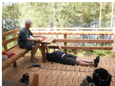
Terassipöydän virittelyä Marjarinteellä.

Uskon, että kykenemme kaikki yhdessä näkemään muuttuvat olosuhteet myös mahdollisuutena, emmekä luovuta ja heitä kirvestä kaivoon ensi vastoinkäymisistä. Meillä on yhdistyksessä pätevä johto, johon toivottavasti saadaan jatkossa vahvistusta nuoremmista jäsenistämme. Kun tähän lisätään kokenut luottamusmiesorganisaatio, liiton laadukas koulutustarjonta ja ammattitaitoiset jäsenet, eivät lähtökohdat uudistusten kääntämiseksi voitoksi ole lainkaan sieltä huonoimmasta päästä. Kuitenkin on realismia ajatella, että vielä jonain päivänä saattaa jäsenmäärämme olla niin pieni, että yhdistymistä johonkin toiseen yhdistyk-