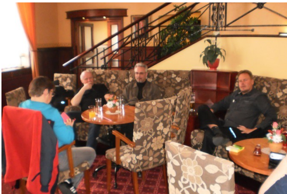
Pärnun-matkalaisia Legend-hotellin aulassa.